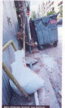
Δεν υπάρχει χώρος για πεζούς.