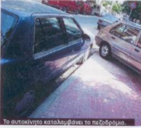
Το αυτοκίνητο καταλαμβάνει το πεζοδρόμιο.

φικής πληροφορικής Τελεπανά, που παίζει τη γεωγραφικά στοιχεία για την υλοποίηση του νέου πλοηγού. Όπως εγγίζει, «τα στοιχεία που χρησιμοποιείται είναι πραγματικά και προέρχονται από το κέντρο διαχείρισης κυκλοφορίας του ΥΠΕΧΩΔΕ, τα οποία συχνά ενημερώνονται από τους οδηγούς ασθετήρες και τις κάμερες που υπάρχουν στους κεντρικούς οδικούς άξονες». Η μόνη παρόμοια υπηρεσία που υπάρχει στη χώρα μας βρίσκεται στην ιστοσελίδα του ΕΜΠ, στην οποία ωστόσο η κίνηση που εμφανίζεται στους δρόμους υπολογίζεται από στατιστικά και ιστορικά στοιχεία. Αντίθετα, όπως εγγίζει οι συγγραμμολογί του ΥΠΕΧΩΔΕ, τα στοιχεία του κέντρου διαχείρισης κυκλοφορίας συλλέγονται από 2.000 αισθητήρες σε 500 θέσεις, μετρητές και ανανεώνονται κάθε ενδέκα λεπτά. Αυτό είναι το κλειδί, σύμφωνα με το συγκεκριμένο κλαδικό, καθηγητή στο Πανεπιστήμιο Πελαίου Σπύρο Παπαδημητρίου: «Η πληροφορία σε πραγματικό χρόνο είναι πολύ σημαντικό εργαλείο στο σχεδιασμό των συστημάτων. Ο χρήστης του συγκεκριμένου πλοηγού μπορεί να υπολογίσει την κίνηση στους δρόμους και να προσμοδίσει ή να